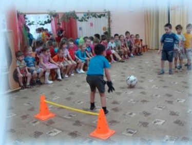
«Мяч + ворота» 6-7 лет