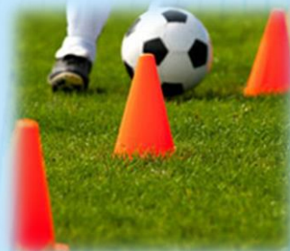
Концентрация на мяче