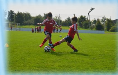
«Мяч + ворота + соперник» 7-8 лет