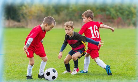
«Мяч + ворота + соперник + партнер» 8-9 лет