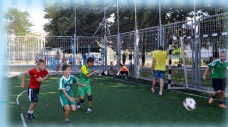
Концентрация на мяче, воротах, сопернике и партнере