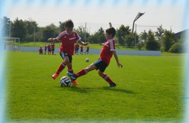
Концентрация на мяче, воротах и сопернике