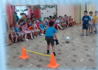
Концентрация на мяче и воротах