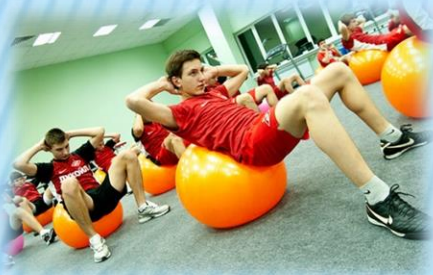
Неспецифические (без мяча)