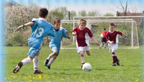
«Мяч + ворота + соперники + партнеры» 9-10 лет